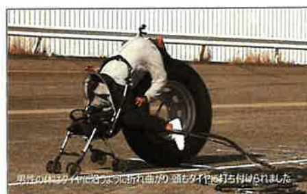
大型車の車輪が人に衝突した時の模擬動画

劣化したホイール・ナット等を使用すると、ホイール・ナットが本来の位置まで締まらず、十分な締結力が得られないため、走行中にホイール・ナットが緩み車輪が脱落するおそれがあります。