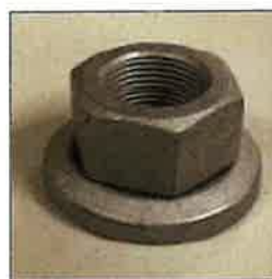
新品のホイール・ナット