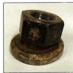
劣化したホイール・ナット