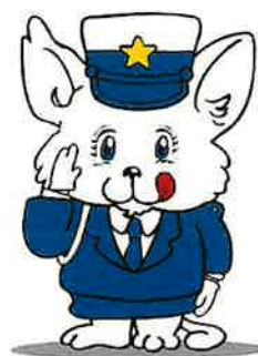
新潟県交通安全マスコット ルルちゃん