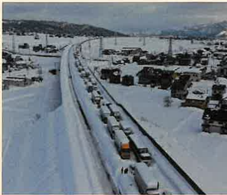
六日町IC～塩沢石打IC（18日11時頃）