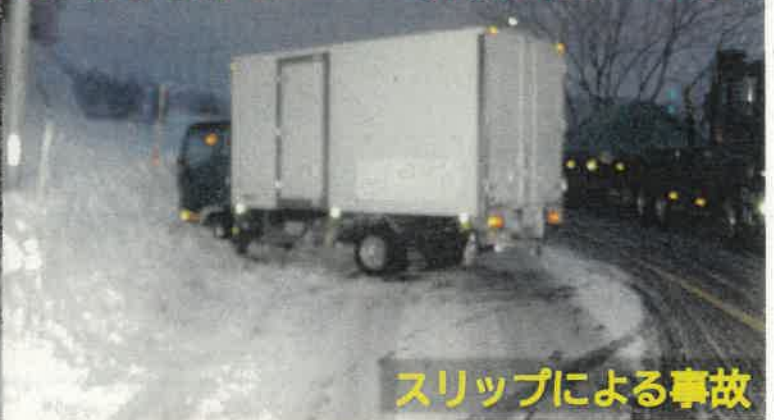
スリップによる事故