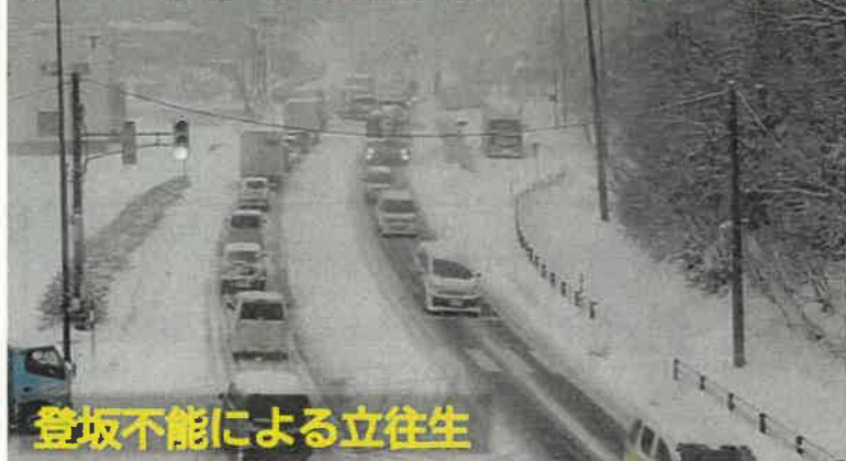
登坂不能による立往生