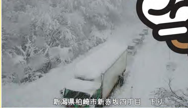
新潟県柏崎市新赤坂四丁目 下り