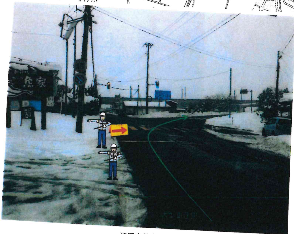
迂回交差点の現況